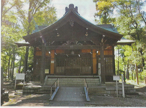
「富士森」の名前の由来となつた浅間神社