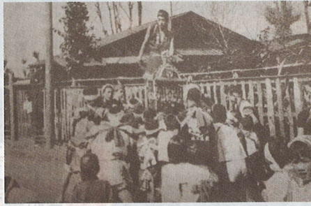
昭和15年ごろの祭礼風景(三小近く)

かではありませんが、おそらく八王子宿が安定した正保の頃(1644年頃)だと思えます。その繁栄は昭和まで続き、上記の「昭和五年の横浜街道沿い商店」マップを見ますと、昭和五年で42軒の商家が並んでいました。菓子屋、製麺業、酒屋、豆腐屋、米屋、魚屋、佃煮屋などの食品製造販売が13軒。染物屋、鍛冶屋、千歯扱き屋(脱穀道具屋)、棒屋、経師屋、建具屋、櫓屋、目立て屋、桶屋、下駄屋、天幕屋、布団屋などの職人関係が15軒。立場、宿屋が四軒あったようです。立場とは、街道で「かごかき」たちが休息する店。現代のドライブ・インのようなものです。