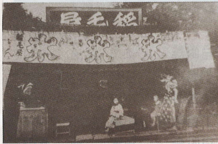
昭和元年ごろの横浜街道沿いのお菓子屋さん稲毛屋の風景

今回のエリアの一部、万町一丁目と万町二丁目に挟まれている国道16号線に面した地域はその昔、十日市場と呼ばれていました。いつ頃から市場の形ができたのかは定