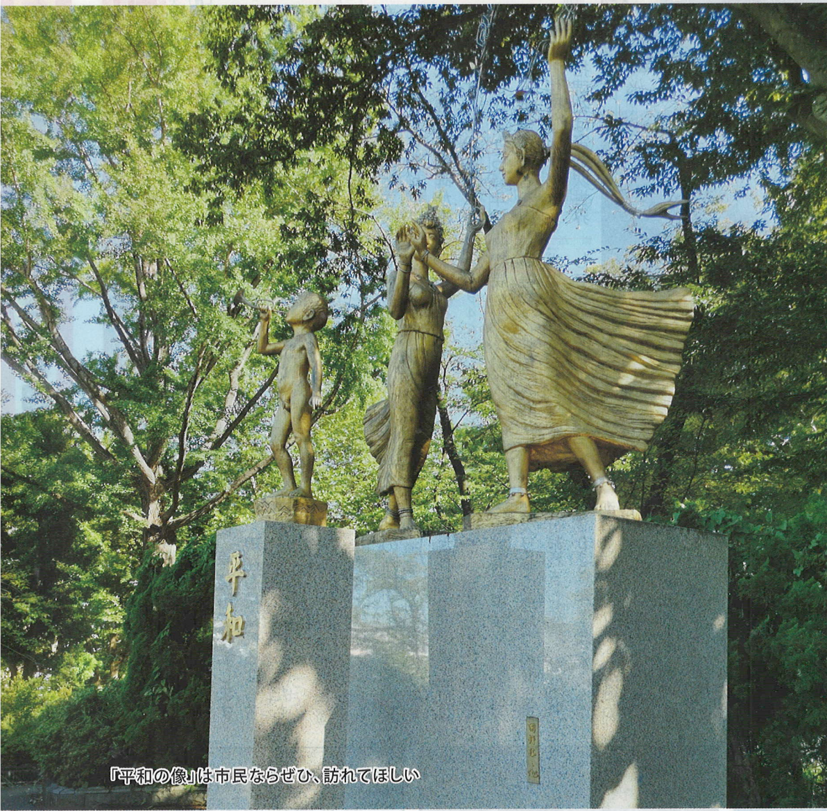
「平和の像」は市民ならぜひ、訪れてほしい