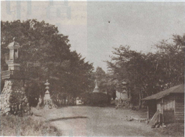
戦没者の魂を祈る「招魂社」と呼ばれたあたり(明治40年ごろ)