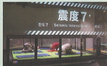
本所防災館での地震体験