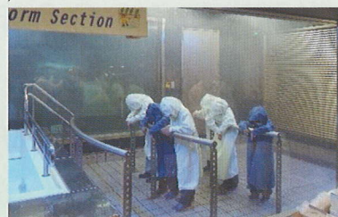
本所防災館での暴風雨体験