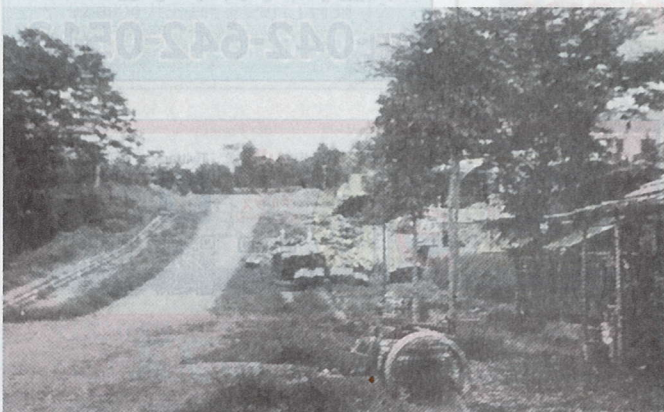
昭和30年代中期のとの木通り坂の下からの風景

今回の特集は東南部エリア。子安町1丁目〜子安町西4丁目、万町1丁目から成る「JR八王子駅南口」エリアです。その昔、ここは自然豊かな子安村と呼ばれた風光明媚なところでした。駅南口開発により宅地化が進み、現在のよう