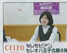
CELEO セレモア セレオ八王子北館 6階