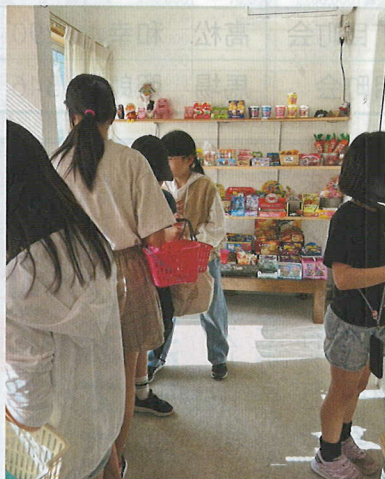
地域の子どもたちはココをたまり場になっている

子安町には八王子で初となる小中一貫校の八王子市立いずみの森義務教育学校があります。2020年4月に開校。1年生から9年生までの12000人余の生徒が在籍しています。