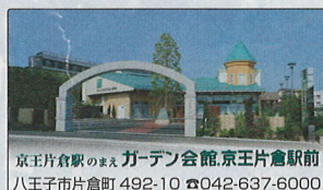
京王片倉駅のまえ ガーデン会館 京王片倉駅前 八王子市片倉町 492-10 ☎042-637-6000