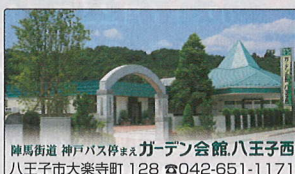
陣馬街道 神戸バス停まえ ガーデン会館 八王子西 八王子市大楽寺町 128 ☎042-651-1171