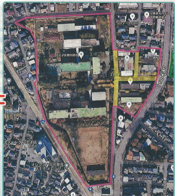
2023年3月の医療刑務所跡