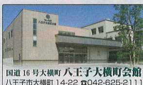
国道 16 号大横町 八王子大横町会館 八王子市大横町 14-22 ☎042-625-2111