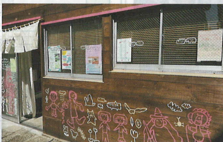
かわいいイラストで目立つ建物

子どもたちの居場所では勉強や英会話などを通して多世代と交流しています。また、子ども食堂やパントリー(食料配布)、高齢者向けのノルディックウォーキング教室やスマホ教室なども運営し、コミュニティを大切にしています。こうした活動は先日NHKで取り上げられ放送されました。