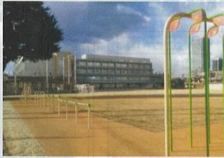
学校の外観 (学校ホームページより)

学びの系統性—1期…1年生~4年生 2期…5年生~7年生 3期…8年生・9年生 生活の系統性 前期課程…1年生~6年生 後期課程…7年生~9年生