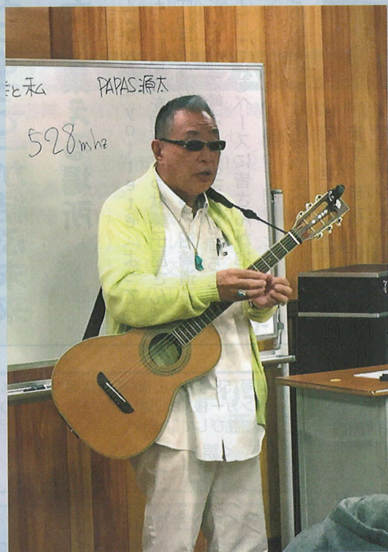
源太さんは、故はしたのりひこ氏と同じグループで活躍したフォークの旗手

きたる7月21日(金)、22日(土)、八王子市で初めての学会が東京たまた未来メッセで行われます。学会なので全国デイ・ケア協会の会員さんが中心なのですが、今回は特別に、一般の方も入れるスペースを広くとっています。八王子芸妓さんのお出迎えのほか、沢山のキッチン・カーも楽しめ、そして最新の福祉機器展示ブースを見学することもできます。