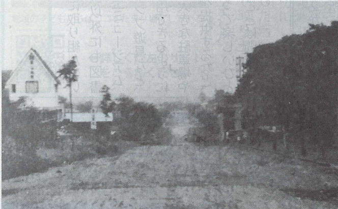
昭和30年代初期のとの木通り坂の上からの風景