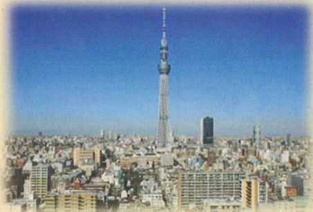
東京スカイツリー