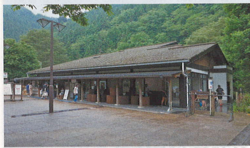
「オンガタVIEW」は無料入場できます

小津倶楽部・恩方ベースとも、中心メンバーは50代から70代ですが、恩方には若い人の「まちづくり」の動きもあります。タやけ小やけふれあいの里入り口前に、この7月10日(土)グランドオープンする直売所「オンガタVIEW」です。今まで担当していたJAが撤退し地域の衰退が懸念され