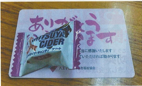
「ありがとうカード」あなたも集めませんか？

相変わらず、視覚障害者の方がホームから落ちる事件は後を絶ちません。そのニュースに触れるたびに「どれほど怖かっただろう」と、胸が締め付けられる思いがします。ところが、私たちのちよっとした気遣いで、その「視覚障害者の恐怖」はなくなっていく。