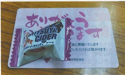
「ありがとうカード」あなたも集めませんか？

相変わらず、視覚障害者の方がホームから落ちる事件は後を絶ちません。そのニュースに触れるたびに「どれほど怖かっただろう」と、胸が締め付けられる思いがします。ところが、私たちのちよっとした気遣いで、その「視覚障害者の恐怖」はなくなっていくます。