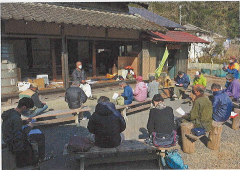
小津倶楽部の拠点古民家「おもむろ」の前でミーティング中

過疎化が進む小津地域を活性化させ、豊かな里山を守ろうと活動しているNPO法人です。町内の古民家を改装し、耕作放棄された畑や山を皆で再生し、野菜を作ったり木材を加工したり、地域の資源を活用した様々なイベントを行っています。それらを地域住民だけでなく、広く一