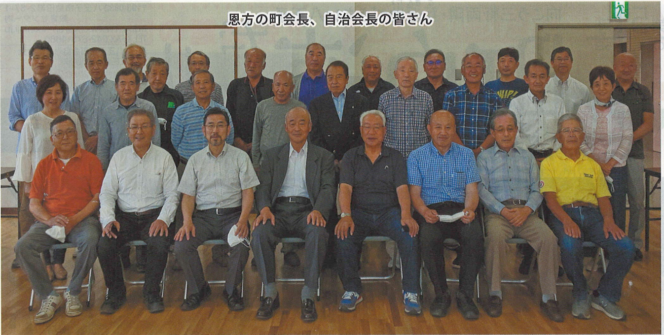
恩方の町会長、自治会長の皆さん