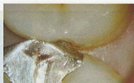
マイクロスコープ