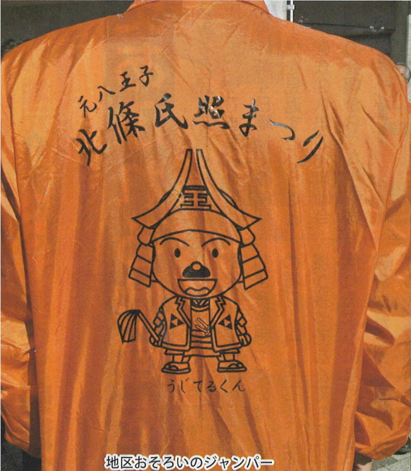
地区おそろいのジャンパー