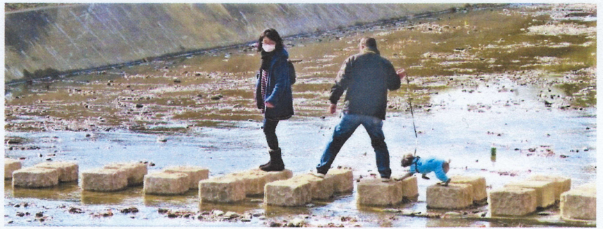
新しくなった南浅川の「飛び石」