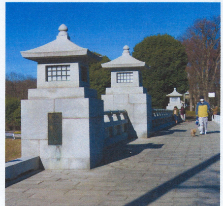
補修、洗浄作業で生まれ変わった御陵橋