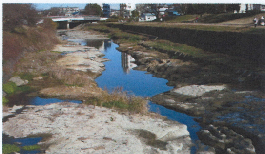
南浅川の水無瀬橋付近

泥岩層は水を通しにくいため川本来の川底になります。今の渇水期では、水の流れば砂利層の下を伏流します。その後三百万年前頃から富士山などの火山が噴火を繰り返し火山灰を大量に降らせ、長房丘陵が含まれる地域一帯を覆います。それが関東ローム層になります。これらが何万年もの経過で雨水の浸食、自然の倒壊を経て現在の地形になっています。