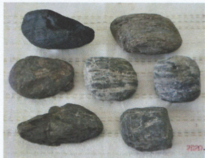
琥珀の結晶が見つかるかも

同じ現象のものが市営長房第二団地近くの五月橋の下の南浅川にも樹木の根、幹の化石を含んだ泥岩層が見えます。これも新生代三紀の堆積層とされています。