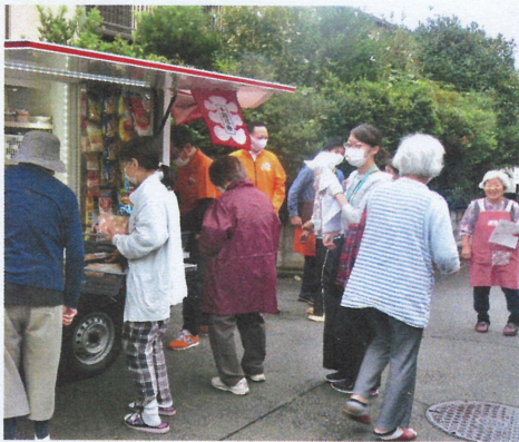
町に移動マーケットがやってきた

発行 長房地域住民協議会 八王子市長房町506-2 八王子市長房市民センター ☎042(664)4774 (公財)八王子市学園都市 文化ふれあい財団