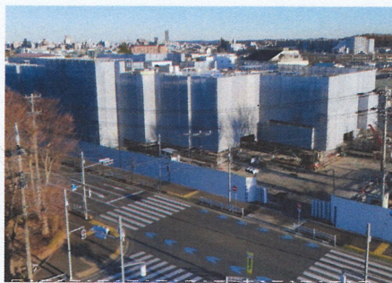
4月開店予定のスーパーマーケット

昨年12月初め、アルプスより近隣の都営団地自治会代表に説明があり、「4月の新店舗開店前に現在の店舗の除却を先行させ、開店後の交通の安全等をはかりたい」とのことでした。除却工事と新店舗開店の期