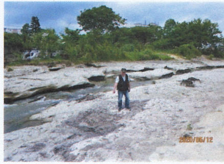
北浅川の泥岩層「化石林」

チャート(硬い岩石)のかけらです。割れ目に二酸化硅素を含んで白い石英が見えるもの等もあります。茶褐色で木目が見える石ころもあります。ミニ石盆でも造って楽しんで下さい。