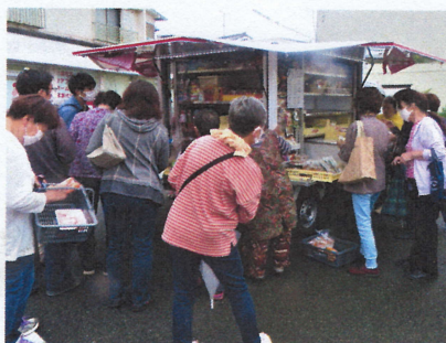
人気の移動スーパー

週2回ほど、設定された時間帯に車で巡回してもらえ、移動スーパーマーケットに地元は重宝しています。船田町会では昨年9月からこのサービスが始まりました。傾斜地が多いこの町には嬉しい企画でした。小型車とはいえ、日常必要