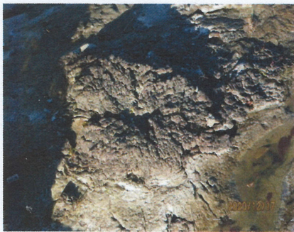
橋の下の重岩化した樹木

長房丘陵は中生代から六千六百万年前の新生代に入り針葉樹・被子植物が繁殖して、イチョウやメタセコイア等の樹木に覆われ、哺乳動物が生息したと思われます。その樹木が、気候の変化等で川や湿地に埋まり土砂に覆われて沈滞し、圧力と地熱で泥岩層を