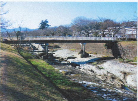
五月橋の下はメタセコイアの化石株が