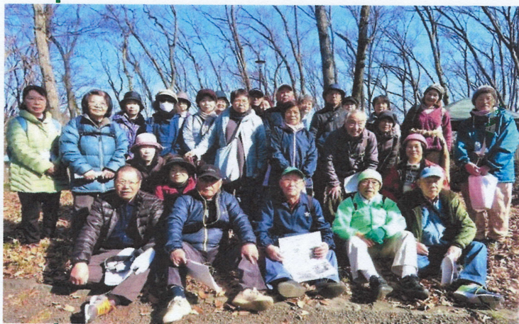
前回のウォーク 令和2年2月8日 出羽山公園