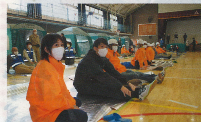
一人一人の間隔をあけて