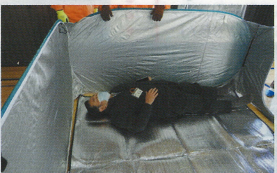
パーテーション内は居心地がいいな