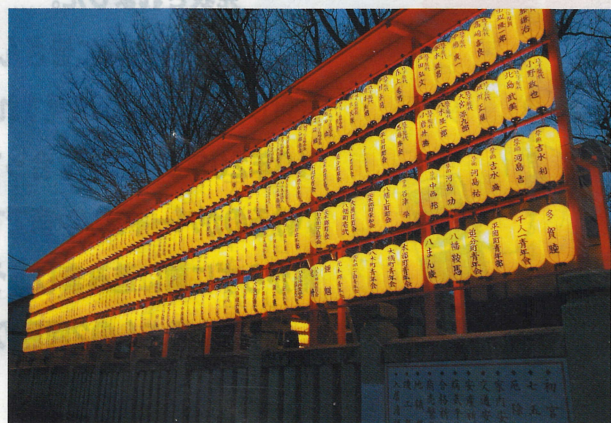
美しく灯った448基の提灯