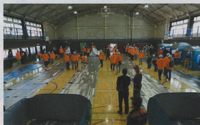
完成後の体育館内です