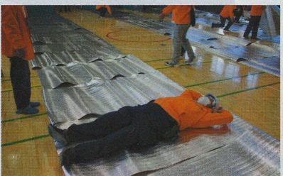
これが一人分のスペースだよ