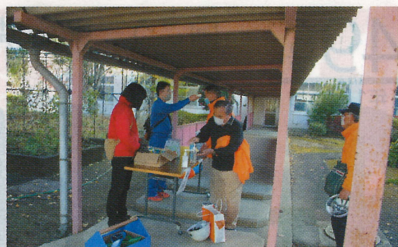
アルコール消毒と検温・避難者受付