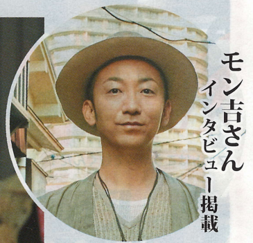
モン吉さん インタビュー掲載