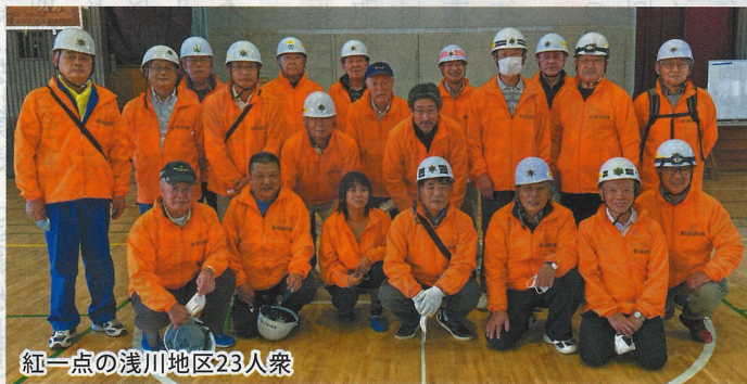
紅一点の浅川地区23人衆

11月21日（土）に浅川地区町会連合会によるコロナ禍における避難所運営シミュレーションが浅川小学校で行われました。 浅川地区では、昨年10月の東日本台風により、大きな被害を受け、避難所に多