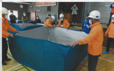
これがパーテーションだな！