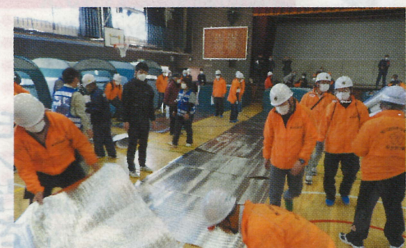
マットはこうやって敷くんだ！