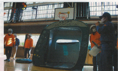
このテントは授乳室にしよう