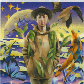
<CD情報> 3rdアルバム「モン吉3」 2021年1月27日発売 MUCD-1466 3,000円+税