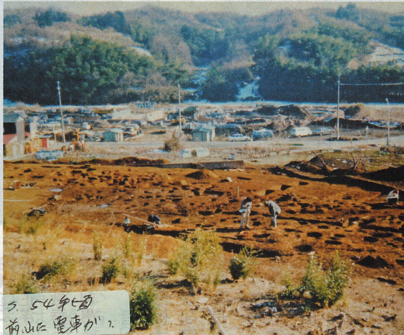
昭和54年頃 前山に電車が