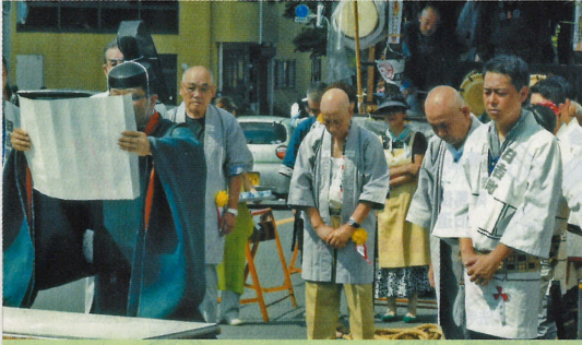
日吉町一丁目町会