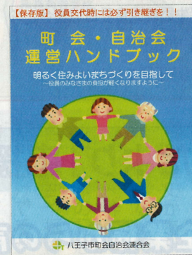
「平成30年度 東京都地域の底力 発展事業助成」対象事業

町自連では、市の協力を得て、町会・自治会の運営に役立てていただくため、「町会・自治会運営ハンドブック(改訂版)」を作成しました。運営ハンドブックは、A4版サイズの冊子で、町会役員の運営の目安として利用していただくとともに、役員交代時にはその役員に必ず引き継いでください。