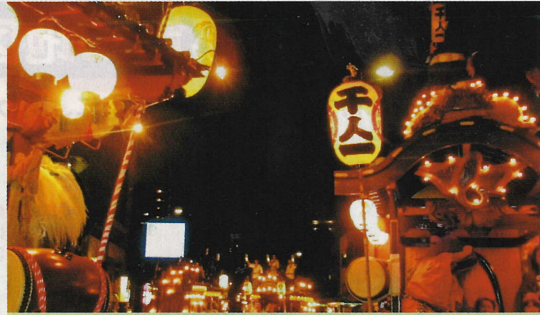
千人町一丁目町会