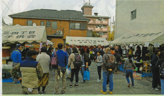
千人町三、四丁目町会