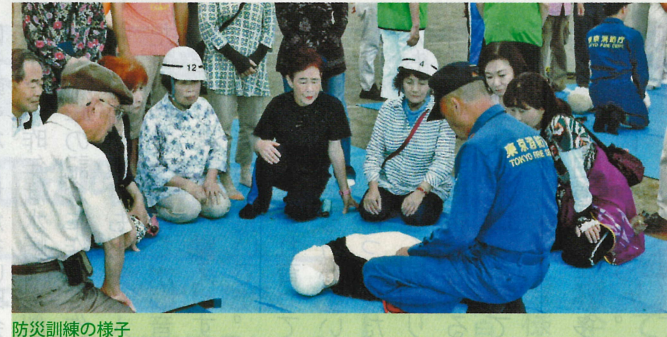
西部第二地区の皆さん